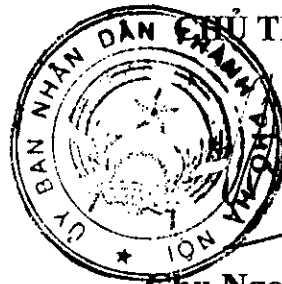
Chu Ngọc Anh